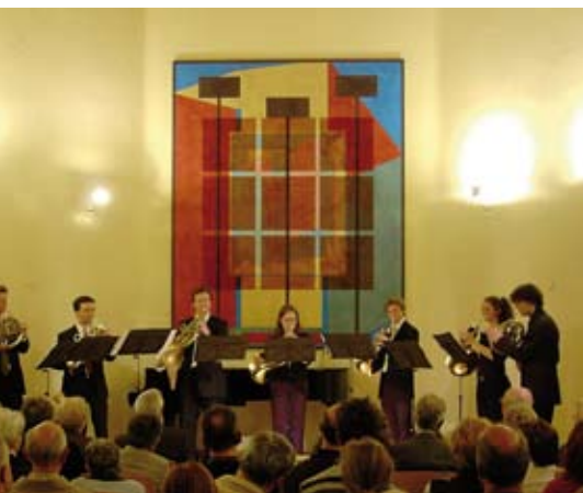
Hornklasse der Musikhochschule Stuttgart